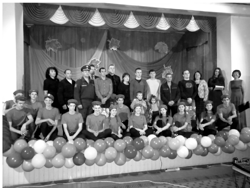
общим фото на память.

Завершился этот небольшой, но очень добрый, благодаря его организаторам даже в какой-то степени домашний праздник